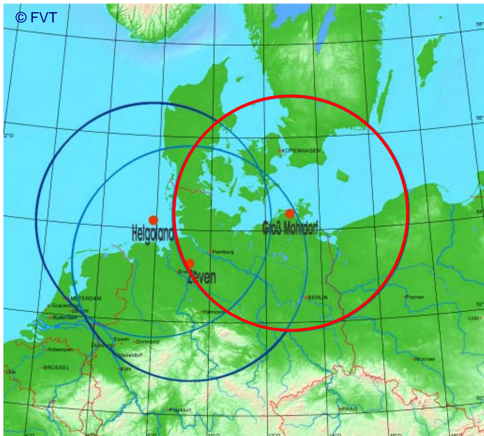
Bild 1: Einfache Reichweitendarstellung der Küsten-DGPS-Referenzstationen in Kreisform; In rot die DGPS-Station Groß Mohrdorf

Die DGPS Referenzstation in Groß Mohrdorf sendet DGPS-Korrektur- und Integritätsdaten mit einer geplanten Nutzreichweite von ca. 285 km aus. Die Übertragung erfolgt für die Station Groß Mohrdorf auf einer Frequenz von 308,0 kHz. Häufig werden die Nutzreichweiten in Form einer einfachen Kreisdarstellung mit einem Radius um die Sendestation dargestellt (Bild 1).