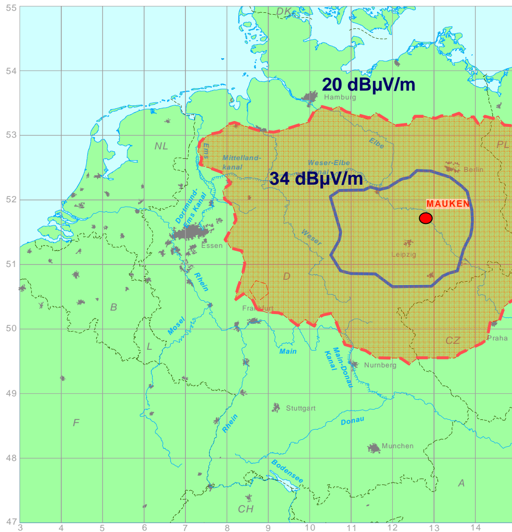
Bild 2: Berechnete Ausbreitung unter Berücksichtigung der Bodenleitfähigkeiten

Die mathematisch berechnete Ausbreitungsprognose basiert auf einer Datenbank von unterschiedlichen Bodenleitfähigkeiten und berücksichtigt keine lokalen Störeinflüsse. Daher ist es ebenfalls notwendig die prognostizierten Ergebnisse durch Messungen zu überprüfen. Entsprechende Feldstärkemessungen und Störsignalaufzeichnungen sind für die DGPS-Referenzstation Mauken im Jahr 2005 durchgeführt worden (siehe Messergebnisse der DGPS Station Mauken).